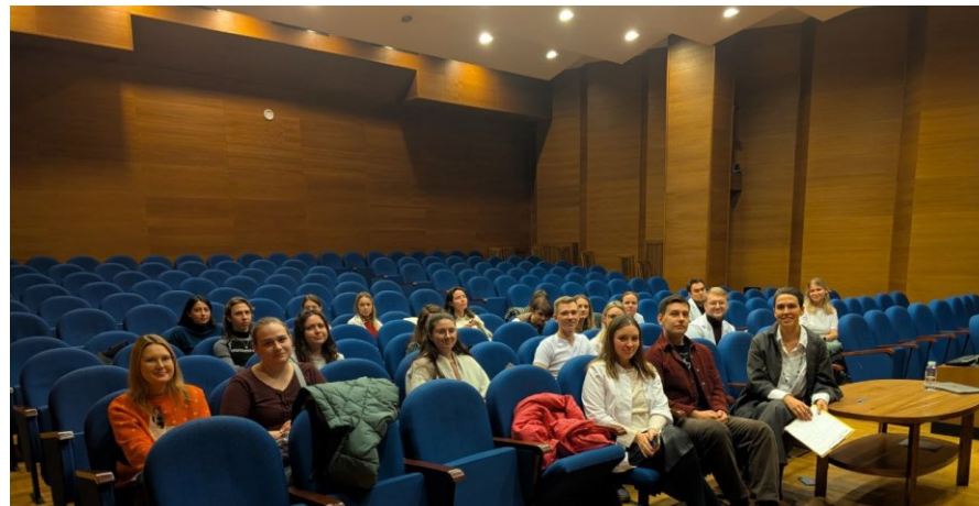
Фото с заседаний